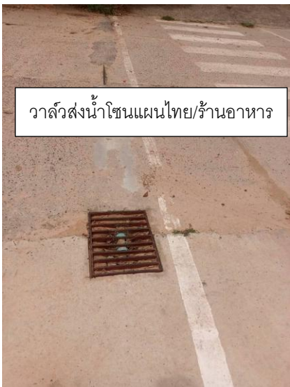
วาล์วส่งน้ำโซนแผนไทย/ร้านอาหาร