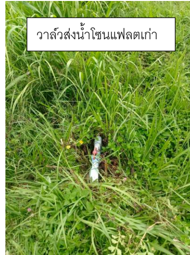
วาล์วส่งน้ำโซนแฟลตเก่า