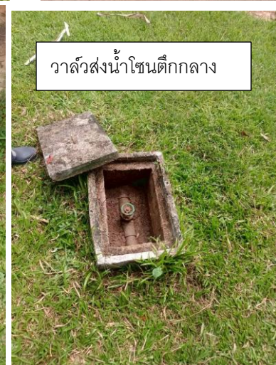
วาล์วส่งน้ำโซนตึกกลาง