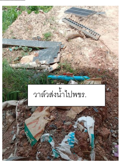
วาล์วส่งน้ำไปพชร.