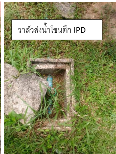
วาล์วส่งน้ำโซนตึก IPD