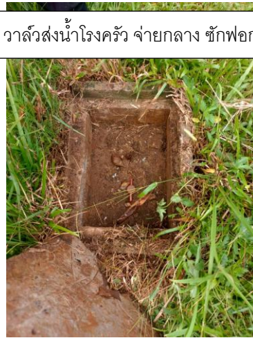
วาล์วส่งน้ำโรงครัว จ่ายกลาง ชักพอก