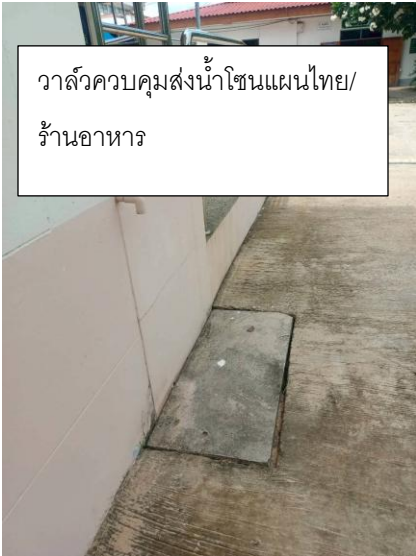
วาล์วควบคุมส่งน้ำโซนแผนไทย/ ร้านอาหาร