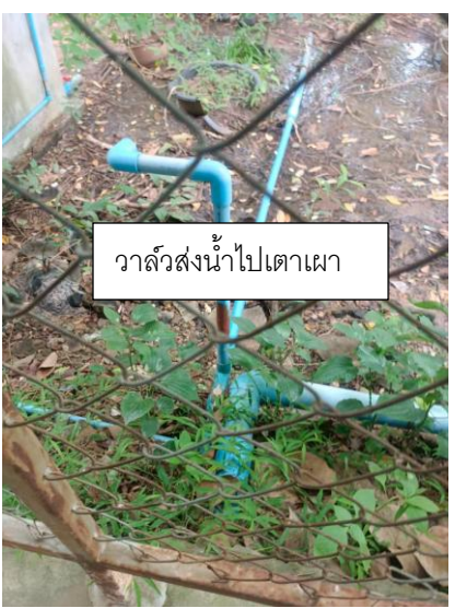
วาล์วส่งน้ำไปเตาเผา