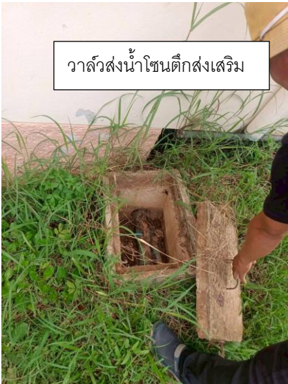
วาล์วส่งน้ำโซนตึกสงเสริม