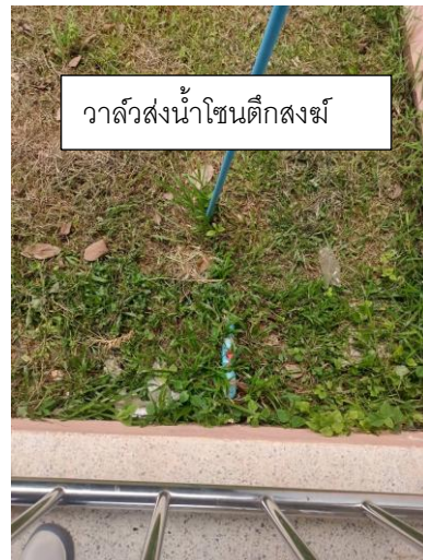
วาล์วส่งน้ำโซนตึกสงฆ์