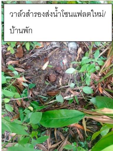
วาล์วสำรองส่งน้ำโซนแฟลตใหม่/ บ้านพัก