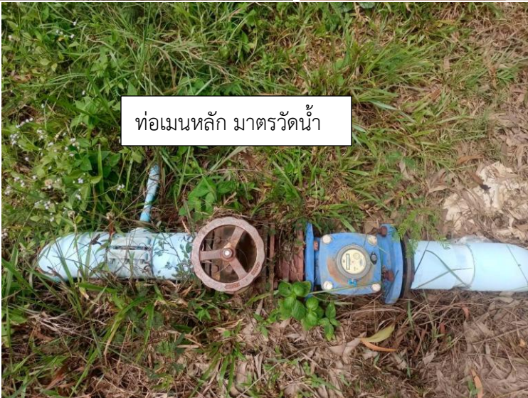
ท่อเมนหลัก มาตรวัดน้ำ