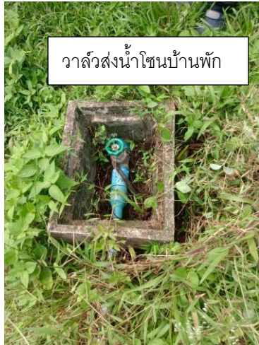
วาล์วส่งน้ำโซนบ้านพัก

รูปภาพแสดงอุปกรณ์ประกอบระบบและโครงข่ายท่อส่งน้ำประปาที่ส่งไปยังตัวอาคารในแต่ละจุด เช่น มาตรวัดน้ำ แนวท่อส่งน้ำ ชนิดของท่อส่งน้ำ ประตูน้ำ สำหรับควบคุมการทำงานหรือใช้สำหรับการปิดซ่อมบำรุงในแต่ละจุด