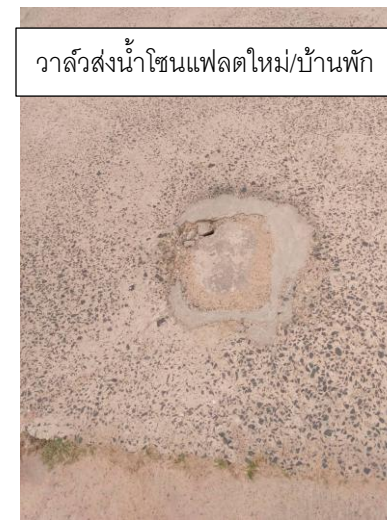
วาล์วส่งน้ำโซนแฟลตใหม่/บ้านพัก