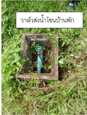
วาล์วส่งน้ำโซนบ้านพัก

รูปภาพแสดงอุปกรณ์ประกอบระบบและโครงข่ายท่อส่งน้ำประปาที่ส่งไปยังตัวอาคารในแต่ละจุด เช่น มาตรวัดน้ำ แนวท่อส่งน้ำ ชนิดของท่อส่งน้ำ ประตูน้ำ สำหรับควบคุมการทำงานหรือใช้สำหรับการปิดซ่อมบำรุงในแต่ละจุด