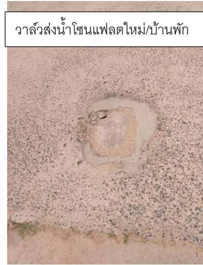
วาล์วส่งน้ำโซนแฟลตใหม่/บ้านพัก