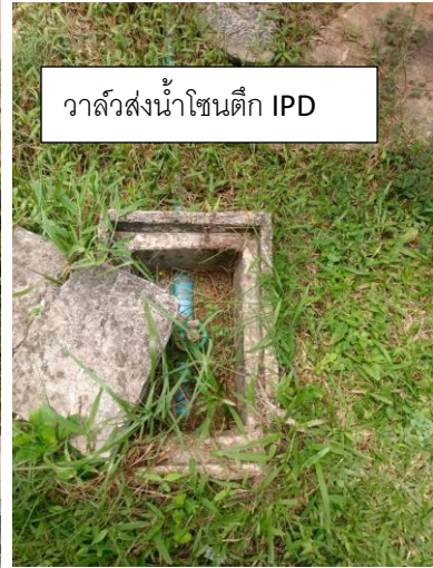
วาล์วส่งน้ำโซนตึก IPD