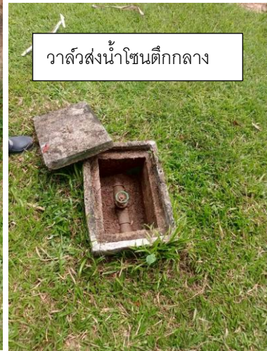
วาล์วส่งน้ำโซนตึกกลาง