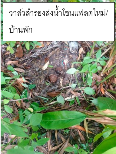
วาล์วสำรองส่งน้ำโซนแฟลตใหม่/ บ้านพัก