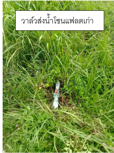
วาล์วส่งน้ำโซนแฟลตเก่า