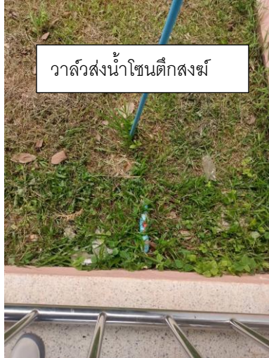
วาล์วส่งน้ำโซนตึกสงฆ์