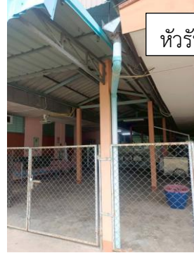
หัวรับน้ำฝน