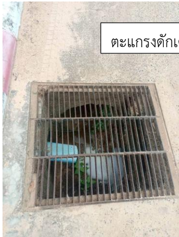
ตะแกรงดักเศษขยะ