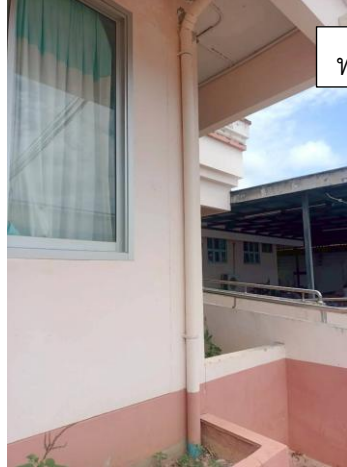
ท่อยื่นระบายน้ำฝน