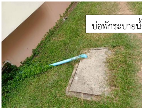
บ่อพักระบายน้ำฝน