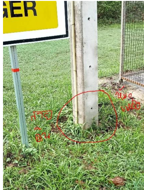
หม้อแปลงไฟฟ้า