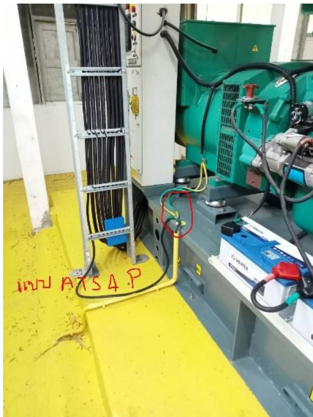
เครื่องกำเนิดไฟฟ้า สำรองฉุกเฉิน