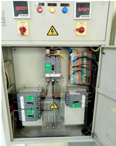
มีระบบการต่อลงดิน