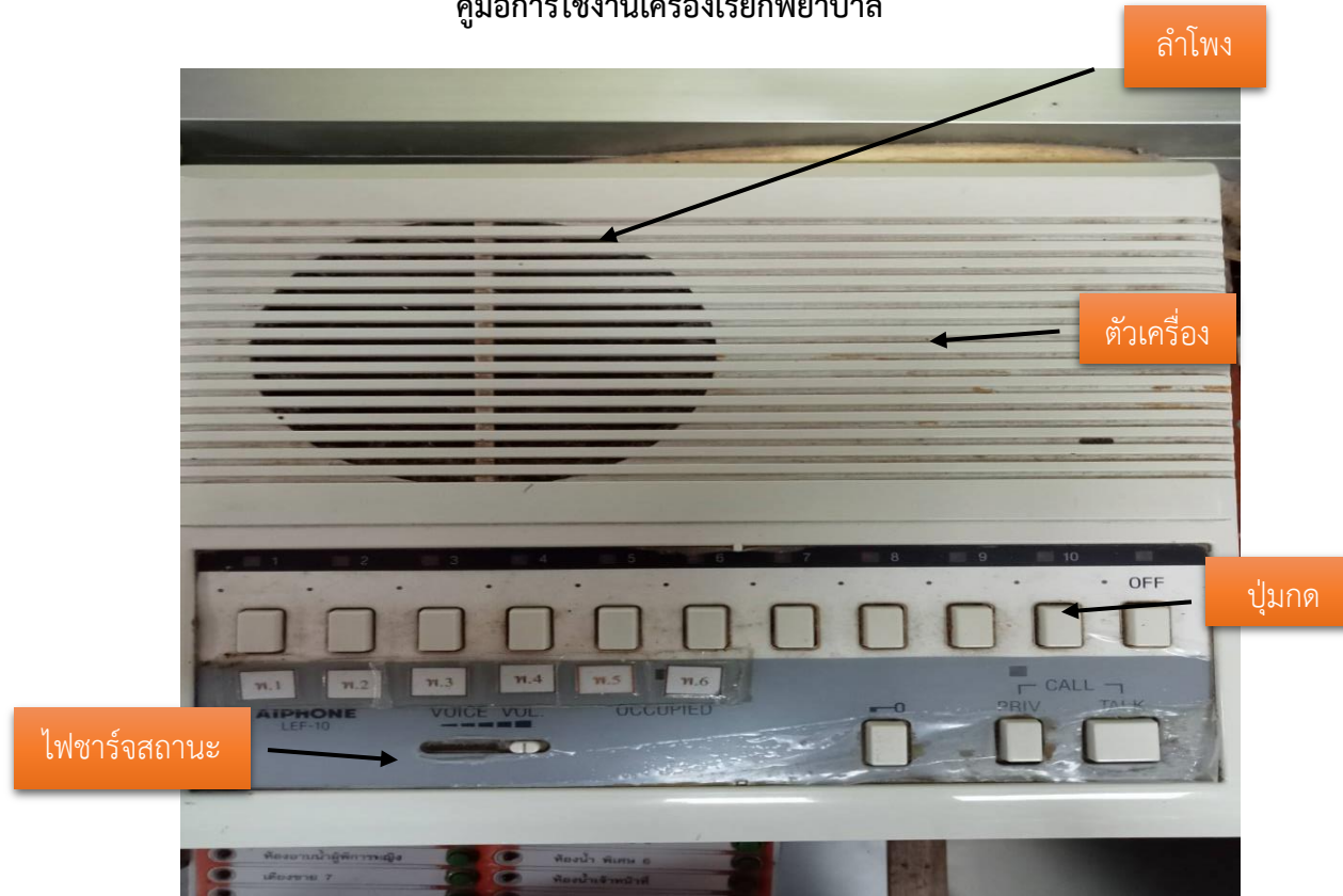
ยี่ห้อ AIPHONE รุ่น LEF - 10