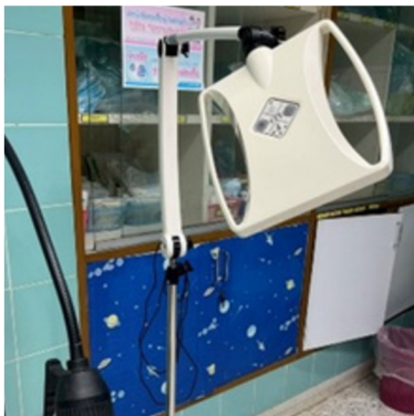
โคมไฟและอุปกรณ์ ส่องสว่าง