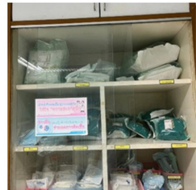
ชุดตรวจภายใน