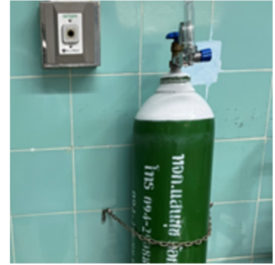
ออกซิเจนและ เครื่องช่วยหายใจ