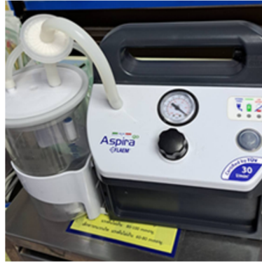
เครื่องดูดเสมหะ ใช้ร่วมกับ ER