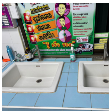
อ่างฟอกมือชนิดที่ไม่ใช้มือเปิดปิดน้ำ