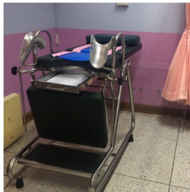
เตียงสำหรับตรวจภายใน