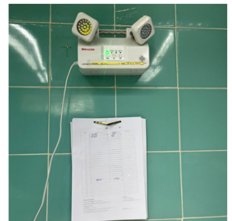
4) ระบบไฟฟ้าและแสงสว่างสำรอง