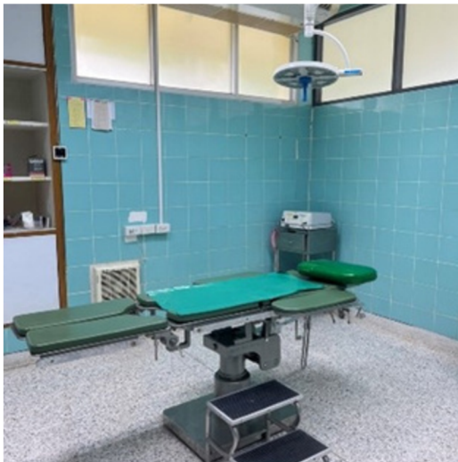
1) เตียงและคอมไฟผ่าตัด

เพื่อให้การให้บริการของห้องผ่าตัดเล็ก เป็นไปอย่างมีคุณภาพ มาตรฐาน มีอุปกรณ์ที่พร้อมใช้งานและตรวจสอบคุณภาพอย่างสม่ำเสมอและพร้อมให้ บริการครบถ้วน ตามที่กำหนด ดังนี้