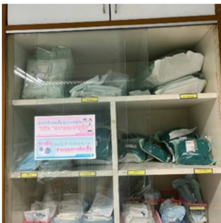
3) ตู้เก็บอุปกรณ์ปราศจากเชื้อ