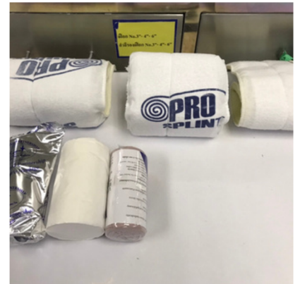
อุปกรณ์ใส่เฝือก