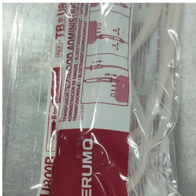
อุปกรณ์ให้เลือด