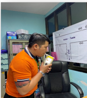
พนักงานขับรถยนต์ได้รับ การประเมินความพร้อม ก่อนออกปฏิบัติงานทุก ครั้ง