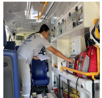
มีการตรวจสอบความ พร้อมใช้งานของรถรับส่ง ผู้ป่วยฉุกเฉิน

จัดให้พนักงานขับรถยนต์เป่าแอสทอลก่อนปฏิบัติงาน 2 ช่วงเวลา (เช้า/เย็น) จัดให้พนักงานขับรถยนต์ผ่านการอบรมขับพนักงานขับรถปฏิบัติการฉุกเฉินและรถพยาบาล และ อบรมอาสาฉุกเฉินการแพทย์ให้ครบทุกคน จัดให้พนักงานขับรถยนต์ ตรวจสอบเช็ครถพยาบาลให้พร้อมใช้ และตรวจอุปกรณ์เครื่องมือ แพทย์ให้พร้อมใช้งานทุกวัน โดย AEMT ทุกวัน