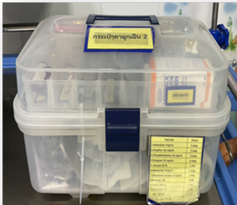
อุปกรณ์ยาและเวชภัณฑ์ ในการช่วยฟื้นคืนชีพ ประจำรถ