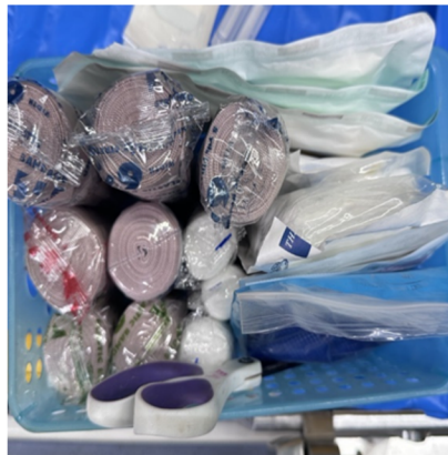
ชุดห้ามเลือด เย็บแผล และทำแผล