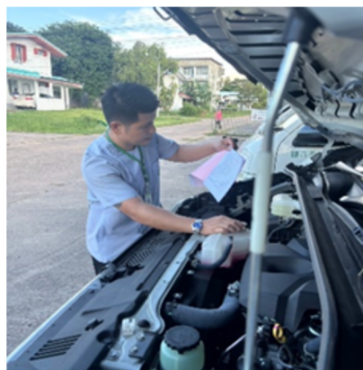
มีการตรวจสอบความ พร้อมใช้งานของรถรับส่ง ผู้ป่วยฉุกเฉิน