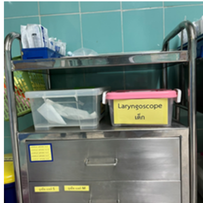
อุปกรณ์ ยาและเวชภัณฑ์ ในการช่วยฟื้นคืนชีพ