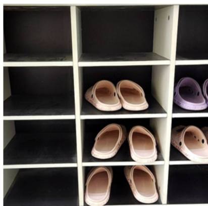
ที่เปลี่ยนรองเท้า