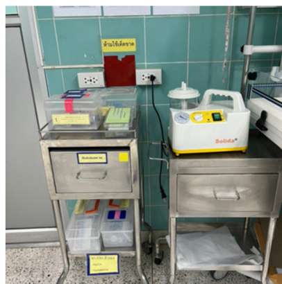
ชุดอุปกรณ์ ยาและเวชภัณฑ์ ในการช่วยฟื้นคืนชีพ