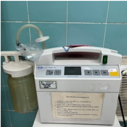
เครื่องดูดเสมหะสำรอง พร้อมใช้งาน