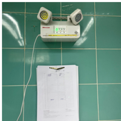
ระบบไฟฟ้าและ แสงสว่างสำรอง