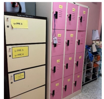
ตู้ใส่ผ้าเปลี่ยนสำหรับ เจ้าหน้าที่