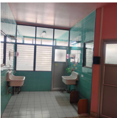
อ่างฟอกมือชนิดที่ ไม่ใช้มือเปิดปิดน้ำ