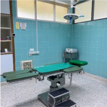
เตียงและคอมไฟผ่าตัด แบบมาตรฐาน

เอกสารแนบ แผนกผ่าตัด เอกสารแนบ แผนกผ่าตัด