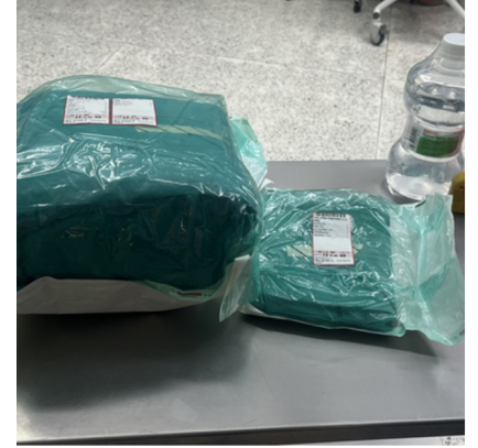
เครื่องมือผ่าตัดที่ได้มาตรฐาน ทางการแพทย์และเพียงพอ