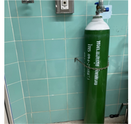
ถังออกซิเจน