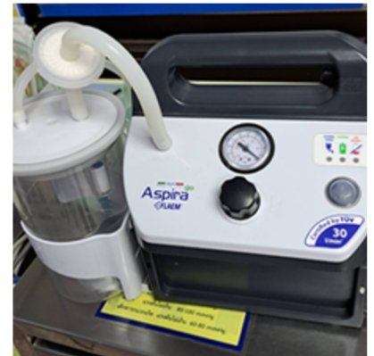
เครื่องดูดเสมหะ ใช้ร่วม กับงานอุบัติเหตุฉุกเฉิน