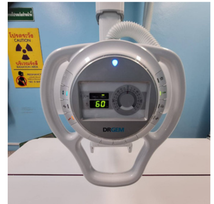
เครื่องเอกเรย์ที่ได้มาตรฐาน ทางการแพทย์