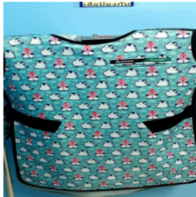
อุปกรณ์วัดและป้องกัน อันตรายจากรังสี