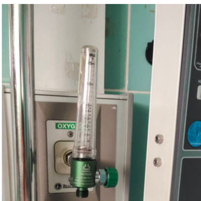
ออกซิเจนและอุปกรณ์ช่วยหายใจ ระบบไฟล้สัญญาณเตือน ขณะเอกเรย์