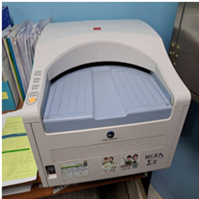
เครื่องล้างฟิล์มระบบ CR-PAC และ DR-PAC