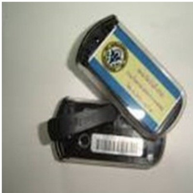
อุปกรณ์วัดและป้องกัน อันตรายจากรังสี

HS9 แผนกรังสีวิทยา จัดให้มีอุปกรณ์พร้อมให้บริการครบถ้วนตามที่กำหนด วัตถุประสงค์ เพื่อให้การให้บริการของแผนกรังสีวิทยา เป็นไปอย่างมีคุณภาพ มาตรฐาน เอกสารแนบ แผนกรังสีวิทยา