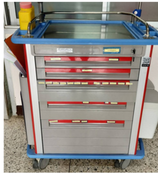
อุปกรณ์ช่วยฟื้นคืนชีพ