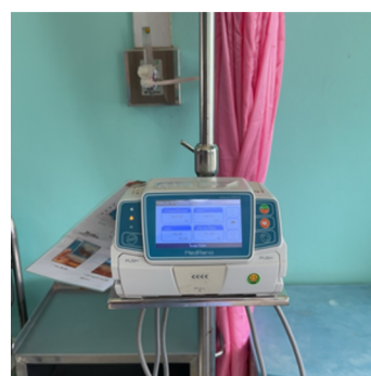
อุปกรณ์ให้สารน้ำทาง หลอดเลือดดำ