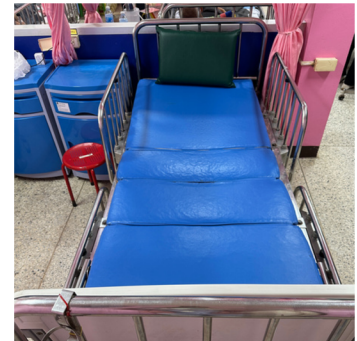
เตียงที่ได้มาตรฐาน ทางการแพทย์