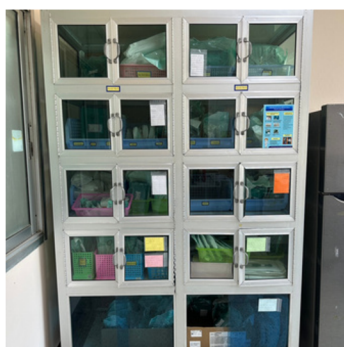
ตู้เก็บเวชภัณฑ์