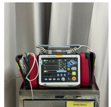
เครื่องกระตุกไฟฟ้าหัวใจ