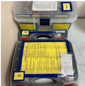
ชุดอุปกรณ์ยาและเวชภัณฑ์