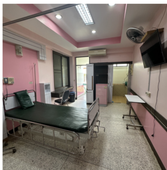
อุปกรณ์ประจำเตียงและ ห้องผู้ป่วย