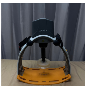
อุปกรณ์ยาช่วยฟื้นคืนชีพ