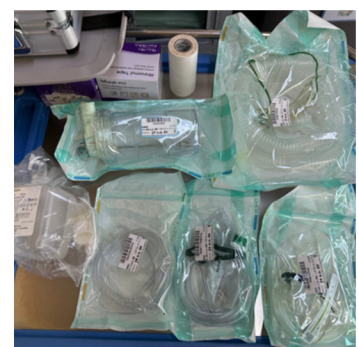
ชุดให้ออกซิเจน