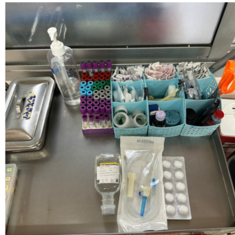
ชุดให้ยาผู้ป่วย