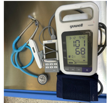
ชุดอุปกรณ์วัดสัญญาณชีพ