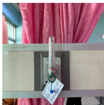
ชุดให้ออกซิเจน