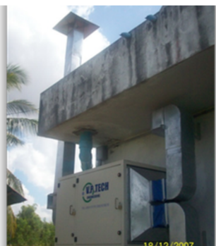
ห้องแยกผู้ป่วยผู้ป่วย