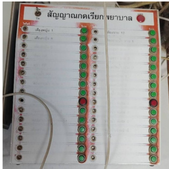
ระบบเรียกพยาบาล