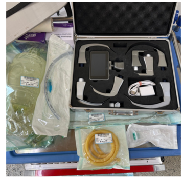
อุปกรณ์ยาช่วยฟื้นคืนชีพ