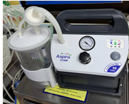
เครื่องดูดเสมหะ