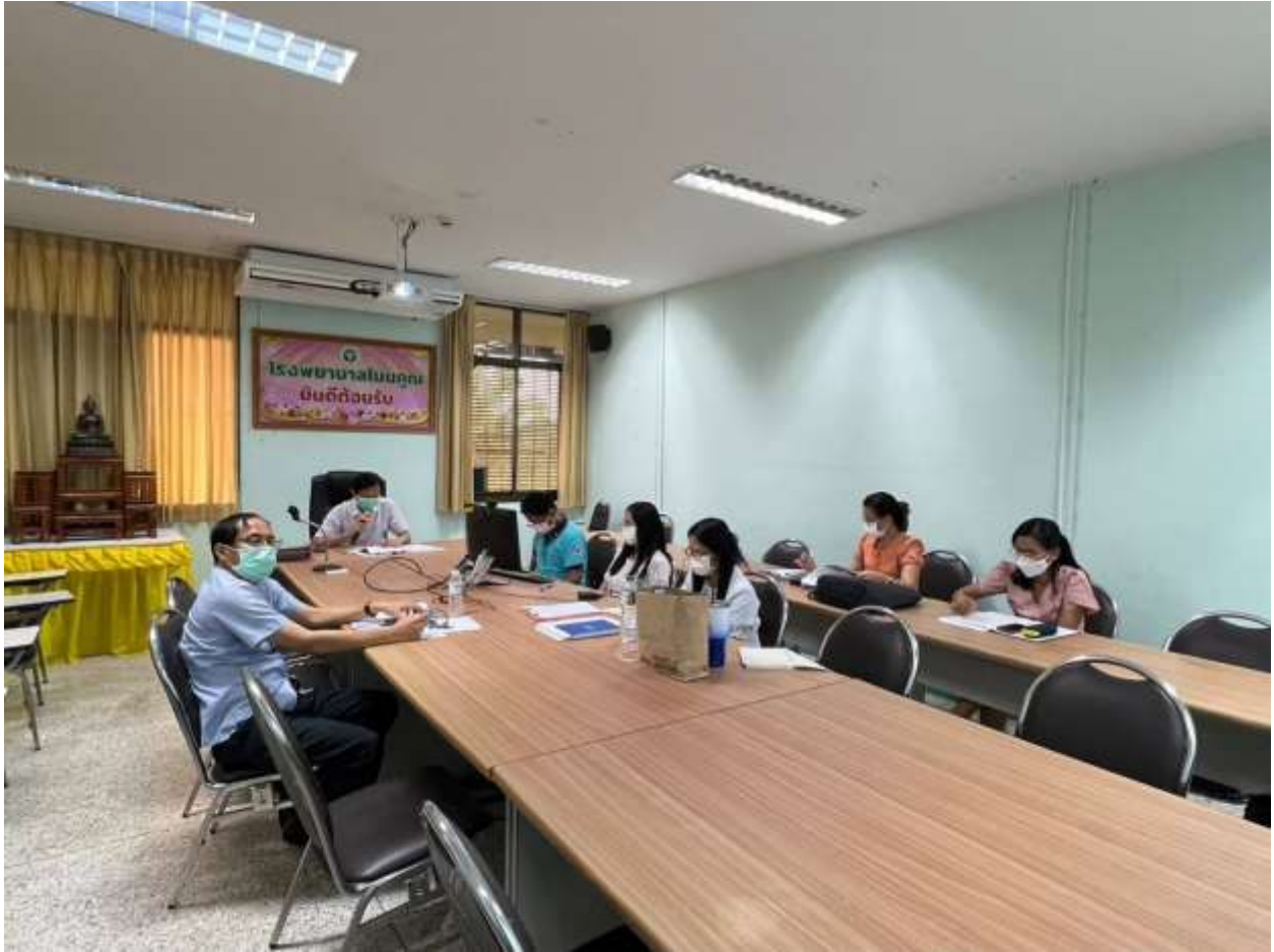
การประชุมทีม ENV