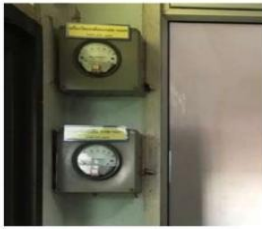
Negative Pressure Room