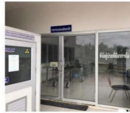
Negative Pressure Room