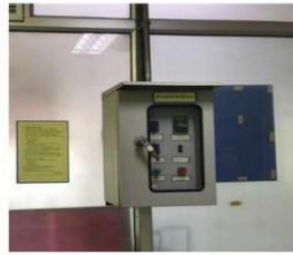
Negative Pressure Room