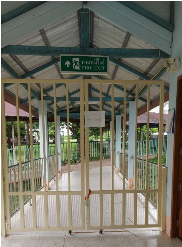
ด้านหลังตึกผู้ป่วยใน

3.3.19 F19E ออกแบบระบบป้องกันการเข้าออก (Access Control) เป็นระบบแบบ MANUAL หรือแบบอัตโนมัติ เพื่อป้องกัน และควบคุมการเข้าถึงในสถานที่เฉพาะ ที่ต้องการความปลอดภัย