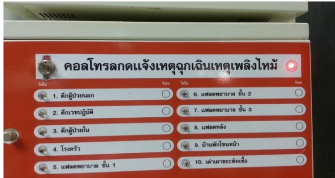
จุดรับแจ้งเหตุที่ ER