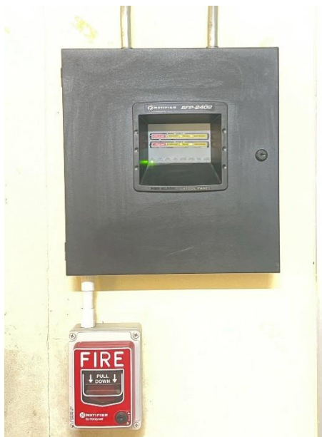
ระบบแจ้งเหตุ ที่ IT