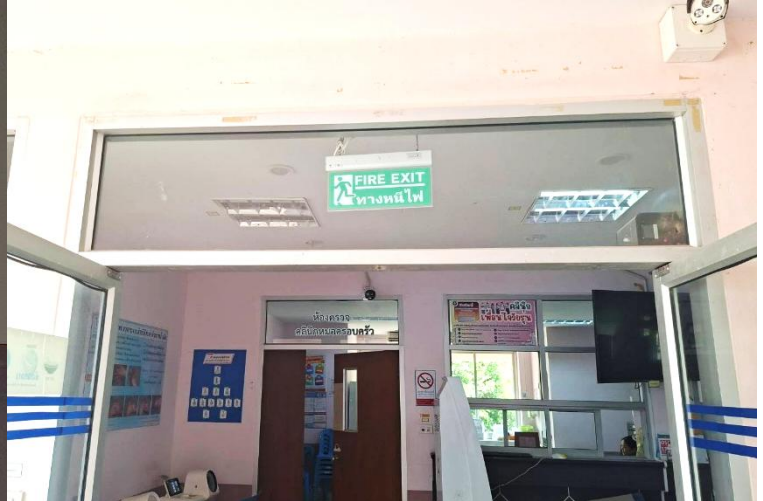
ป้ายทางหนีไฟในหน่วยงาน