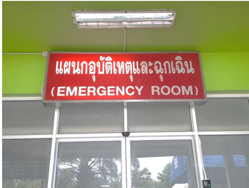
ป้ายหน่วยงานและไฟส่องสว่าง