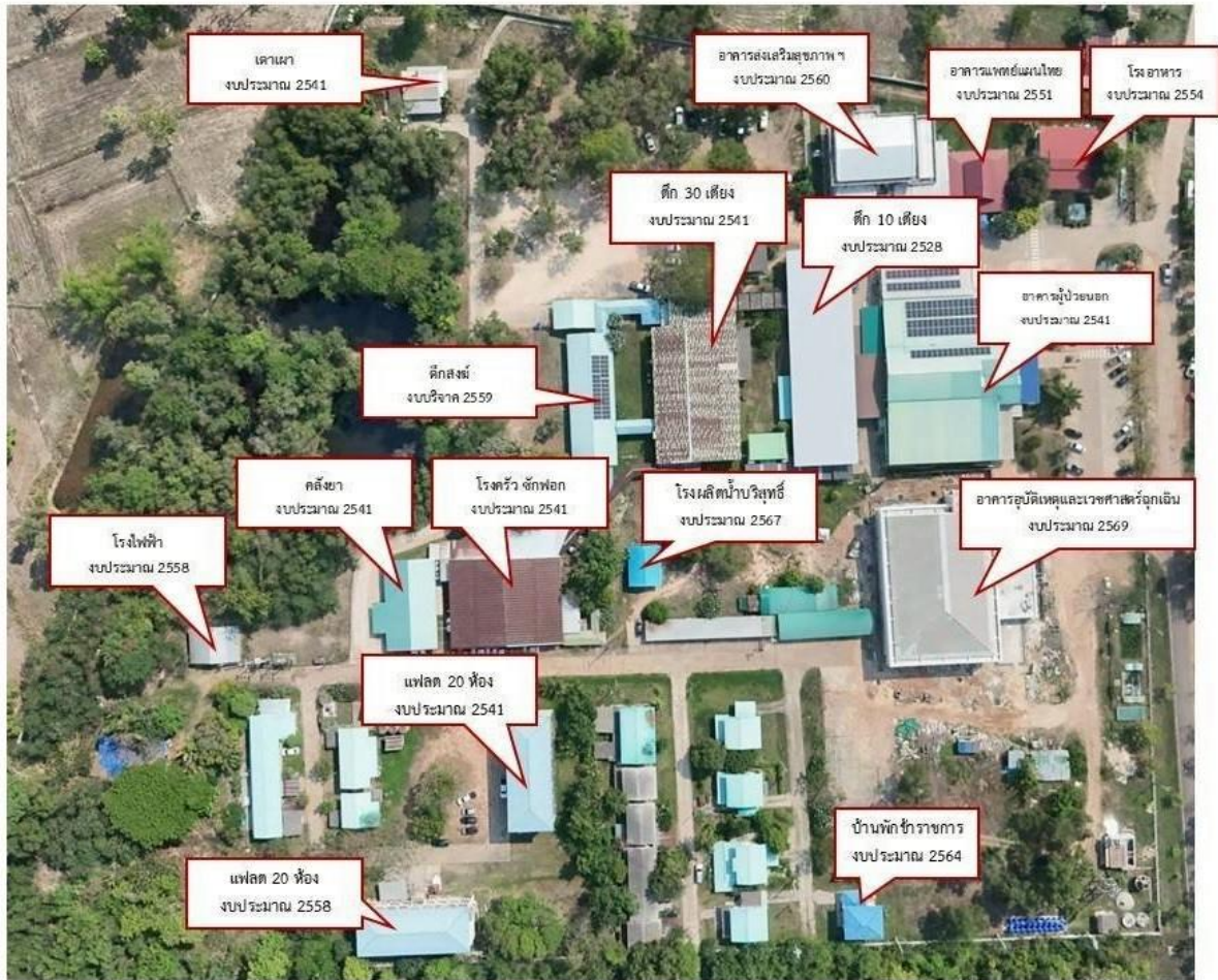
แผนผังโรงพยาบาลโนนคูณ 2569