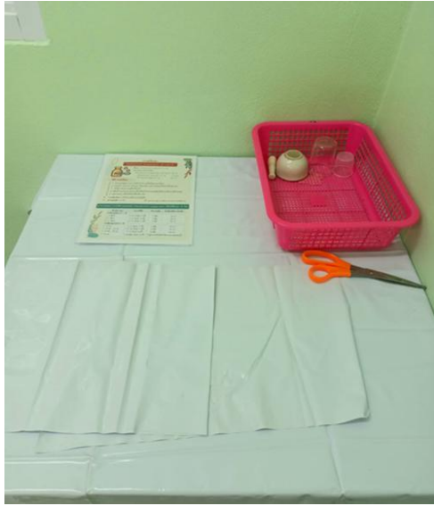
จุดเตรียมยาเฉพาะราย