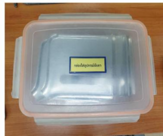
กล่องเก็บอุปกรณ์เตรียมยา