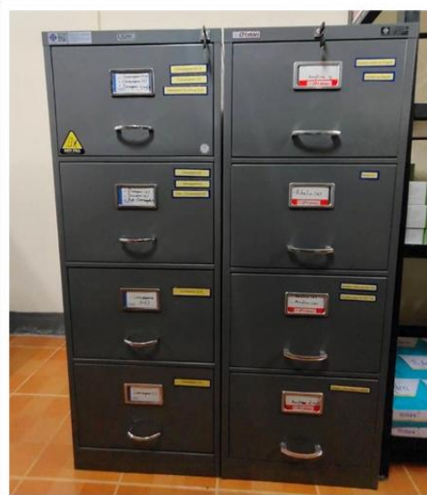
ตู้เก็บยาเสพติดให้โทษ และวัตถุออกฤทธิ์ต่อจิตประสาท