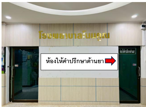
ห้องให้คำปรึกษาด้านยา