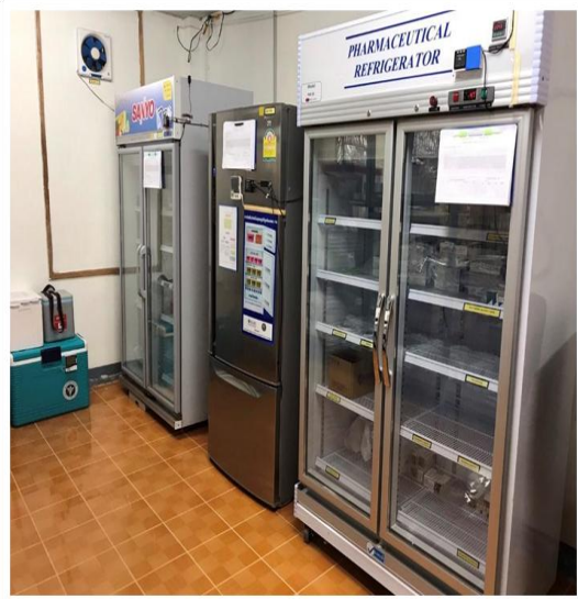
ตู้เก็บยาแช่เย็น และวัคซีน มีการควบคุมให้เป็นไปตามมาตรฐาน