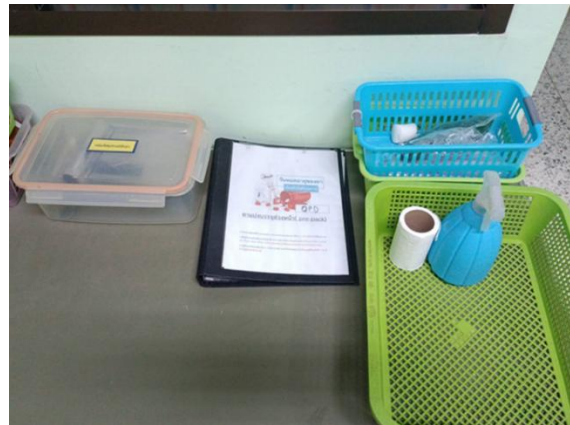
จุดเตรียมยา แบ่งบรรจุ

บริเวณสัดส่วนพื้นที่: ผสมยาสำหรับผู้ป่วยเฉพาะราย และการจัดเก็บ