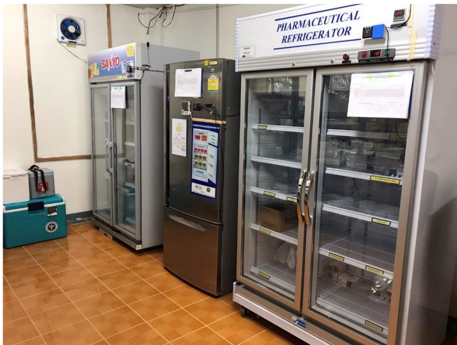
ตู้เก็บยาแช่เย็นและวัคซีนมีการควบคุมให้เป็นไปตามมาตรฐาน

แผนกเภสัชกรรม คลังยามีตู้หรือชั้นเก็บยา เวชภัณฑ์ที่เป็นสัดส่วน เป็นไปตามมาตรฐานกำหนด