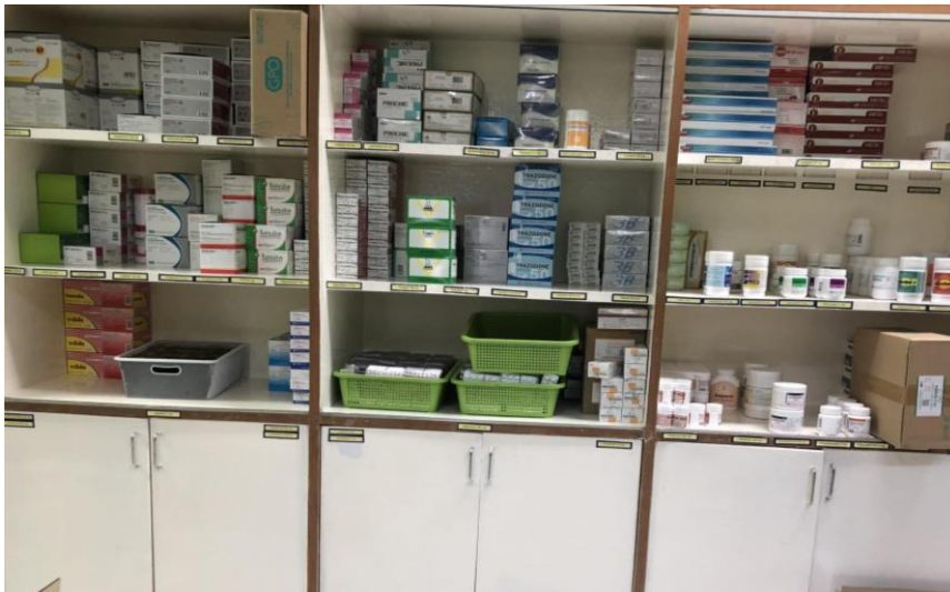
ตู้เก็บยา stock

แผนกเภสัชกรรม ห้องยามีตู้หรือชั้นเก็บยา เวชภัณฑ์ที่เป็นสัดส่วน เป็นไปตามมาตรฐานกำหนด