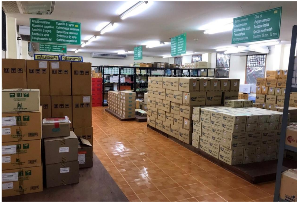
ชั้นเก็บยาเวชภัณฑ์