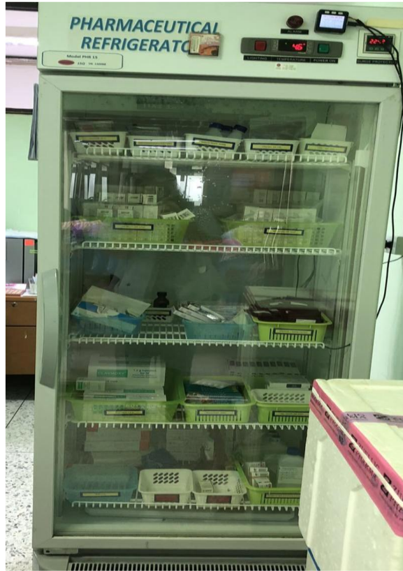
ตู้เก็บยาที่อุณหภูมิ 2 - 8 องศา