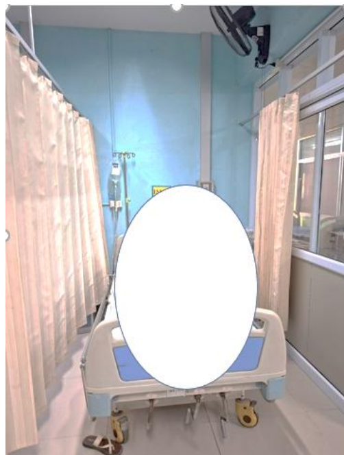
แผนกผู้ป่วยใน IMC หน่วยดูแลผู้ป่วยระยะกลางระหว่างเตียงบริเวณตั้งเตียง เป็นไปตามมาตรฐานกำหนด