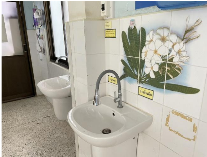
อ่างล้างมือห้องตรวจโรคตี๊กผู้ป่วยนอก

3.1.5 B05I ภายในห้องตรวจ หรือ หลังห้องตรวจ ออกแบบให้มีการติดตั้งอ่างล้างมือสำหรับแพทย์ โดยแยกจากอ่างเทล้างสกปรกหรือล้างวัสดุอุปกรณ์ และเลือกใช้ก๊อกน้ำชนิดไม่ใช้มือสัมผัส (เช่น ก้านปิดด้วยข้อศอก หรือแบบเซนเซอร์)